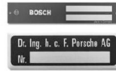
Typenschilder im Untereloxdruck

sind langjährige Informationsträger. Oft sind sie widrigen Umständen wie Abrieb, Öl, usw. ausgesetzt.