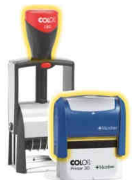
Antibakterielle Stempel für den medizinischen Bereich

Der Stempelgerätehersteller Colop bietet spezielle Microban® - Stempel an, deren Griffe oder Griffkappen einen antibakteriellen Schutz bieten. Dies sind die empfohlenen Stempel für Ärzte und Kliniken oder auch für Bereiche, in welchen die Stempel von mehreren Personen benutzt werden wie zum Beispiel in der Fertigung oder im Lager. Weitere Informationen finden Sie in unserem Stempel-Ratgeber www.stempel-bestellen.net .