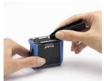
Stempel zum Selbersetzen

Do-it-yourself - Stempel sind praktische Helfer im Alltag, wenn man gelegentlich verschiedene Texte stempeln möchte. Da das zentrierte Setzen der kleinen Gummibuchstaben aber ein gewisser Aufwand ist, eignen sich die Stempel zum Selbersetzen nur für den gelegentlichen Einsatz. Auch liefern diese D-I-Y-Stempel ein weniger gutes Abdruckbild als ein normaler Stempel. Sie sind erhältlich als einfache Kunststoff-Selbstfärber ( Trodat Typomatic Printy 4912 ) oder als hochwertige Metallstativstempel. Selbst mobile Taschen-Stempel sind in der D-I-Y-Ausführung lieferbar. Den D-I-Y-Stempel von Trodat oder Colop liegen als Zubehör Buchstabensets und eine Pinzette bei, welche man auch einzeln nachbestellen kann.