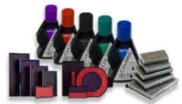
Stempelfarben und Stempelkissen

Wissenswertes über die komplizierte Welt der Stempelfarben finden Sie in unserem Stempel-Wiki www.stempel-bestellen.net . Die gebräuchlichsten Ersatzkissen haben wir schnell ab Lager lieferbar. Stempelkissen für ältere Stempelmodelle (z.B. Alpo - Stempel) erhalten Sie ebenfalls bei uns. Was wir nicht im Shop gelistet haben, können wir natürlich für Sie bestellen. Wir führen Stempelfarben von den führenden Herstellern wie der Firma Noris oder Trodat. Es gibt Stempelfarben für viele verschiedene Anwendungsfälle wie zum Beispiel zum Bestempeln von glatten, nichtsaugenden Oberflächen oder Stempelfarben auf Öl- oder Alkoholbasis.