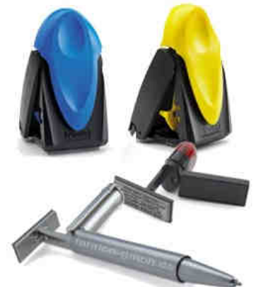
Mobile Stempel für unterwegs

Mobile Stempel sind derart konstruiert, dass keine unbeabsichtigten Stempelabdrucke oder Stempelfarbe die Tasche beschmutzen können. Es gibt diese in vielen verschiedenen Abdruckgrößen und -formen von rechteckig, rund und sogar oval. Alle Modelle von Trodat oder Colop haben ein austauschbares Stempelkissen, das auch nachgetränkt werden kann. Selbst einen Stempel zum Selbersetzen gibt es als mobilen Taschenstempel.